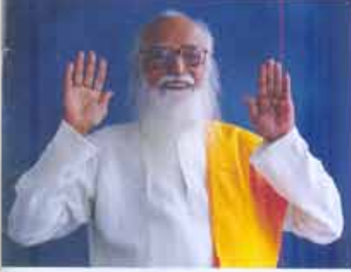
அருட தந்தை வேதாத்திரி மகரிஷி